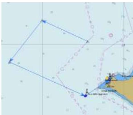
Grafico percorso puramente indicativo

PERCORSO 3. Partenza – Boa 1 – Boa 2 – Isola dello Sparviero da lasciare a sinistra – Arrivo