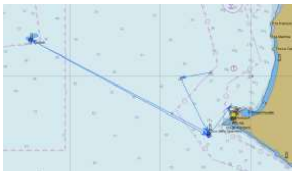
Grafico percorso puramente indicativo

PERCORSO 2. Partenza – Boa 1 (se posizionata) a circa 1,5 MN dalla linea di partenza – Isola dello Sparviero da lasciare a dritta – Isola di Cerboli da lasciare a sinistra – Isola dello Sparviero da lasciare a sinistra - Arrivo